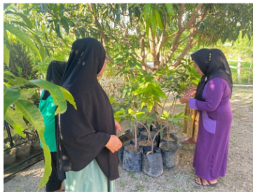
Gambar 5. Pembagian Paket Bantuan Bibit

Hasil observasi, peserta mampu memahami materi pelatihan dan segera mempraktekkannya di pekarangan rumah mereka masing-masing. Observasi lapangan menunjukkan bahwa peserta telah menanam minimal dua jenis tanaman pangan di pekarangannya. Keberhasilan awal ini tidak hanya meningkatkan ketersediaan sayuran segar, tetapi juga memunculkan interaksi sosial berupa berbagi hasil panen dengan tetangga sekitar, yang menjadi bentuk awal ekonomi berbasis solidaritas lokal. Temuan ini sejalan dengan pandangan dari DEWI KURNIATI (2019) bahwa program kebun pangan rumah tangga terbukti meningkatkan ketersediaan pangan dan mengurangi pengeluaran rumah tangga.