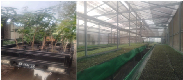
Gambar 3. Persediaan tanaman produktif

Kegiatan edukasi dilaksanakan pada 18 Juli 2025 di kediaman Kepala Desa Sidera. Kegiatan ini dihadiri oleh perangkat desa, tokoh masyarakat, serta ibu-ibu rumah tangga yang menjadi ujung tombak ketersediaan pangan keluarga. Pandangan Taenasah et al. (2024) dan Ezzeddin et al. (2024) bahwa peran aktif perempuan dalam pengelolaan pangan rumah tangga merupakan kunci ketahanan pangan tingkat mikro. Peran ibu-ibu rumah tangga dalam kegiatan ini sangat penting, karena mereka bertanggung jawab atas pemilihan menu, pengolahan bahan pangan, dan pemeliharaan tanaman pekarangan. Keterlibatan perempuan dalam program pangan skala rumah tangga juga terbukti meningkatkan keberlanjutan dan keberagaman gizi keluarga.