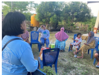
Gambar 7. Focus Grup Discussion

Selain kunjungan ke pekarangan rumah warga, tim juga mengadakan sesi diskusi kelompok untuk menampung kendala peserta, seperti keterbatasan air dan kesulitan menjaga konsistensi pemupukan. Diskusi kelompok ini dirancang sebagai forum berbagi pengalaman dimana peserta dapat saling berbagi tantangan teknis yang peserta hadapi dalam pemanfaatan pekarangan rumah. 18 serangan hama tanaman, gangguan cuaca yang tidak menentu, dan keterbatasan air. Pendekatan ini sejalan dengan temuan Ulyasniati et al. (2023), yang menunjukkan bahwa respon positif dan keberhasilan adopsi teknologi oleh Kelompok Wanita Tani (KWT) sangat dipengaruhi oleh adanya ruang partisipasi aktif dalam kelompok. Ketika peserta diberikan wadah untuk saling bertukar pengalaman (interaksi sosial), tingkat kepercayaan diri mereka dalam mengatasi hambatan teknis (seperti hama atau iklim) meningkat signifikan dibandingkan jika hanya menerima instruksi satu arah.