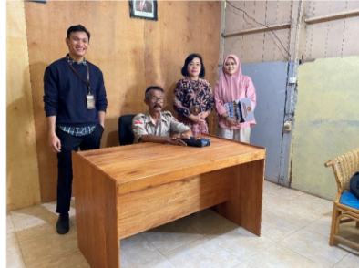
Gambar 2. Kunjungan Awal

Hasil pemantauan tim pengabdian menemukan bahwa sebagian besar pekarangan warga belum dikelola produktif. Hambatan yang teridentifikasi meliputi ketiadaan pagar pelindung, prioritas tenaga kerja pada lahan pertanian utama, serta keterbatasan pasokan air yang hanya mengalir pada jam tertentu. Faktor-faktor ini menyebabkan potensi pekarangan yang subur belum memberi nilai tambah signifikan bagi ketahanan pangan rumah tangga.