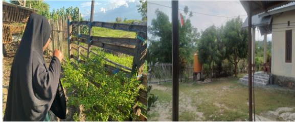
Gambar 8. Kunjungan Pekarangan Rumah Peserta

Pendekatan partisipatif ini terbukti sangat efektif dalam mendorong peserta untuk saling berbagi pengalaman dan solusi lokal yang telah terbukti berhasil di lingkungan Desa Sidera. Dalam sesi diskusi ini, peserta yang lebih berpengalaman dapat memberikan pengetahuan kepada peserta lainnya, menciptakan sistem pembelajaran peer-to-peer yang berkelanjutan. Tim pengabdian juga memanfaatkan momen tersebut untuk mengidentifikasi pola kendala yang sering muncul, seperti masalah keterbatasan sumber air yang dialami oleh seluruh peserta di Desa Sidera, serta kesulitan dalam manajemen pemupukan yang konsisten karena keterbatasan pengetahuan peserta terkait dengan teknis budidaya.