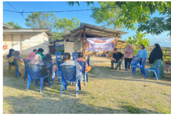
Gambar 6. Edukasi Gizi dan Pola Konsumsi

Selain itu, edukasi menekankan dampak positif dari pengelolaan limbah organik menjadi kompos dan pengurangan kemasan plastik akibat berkurangnya pembelian sayuran di pasar. Hana Ridha Luthfiah et al. (2025) menuturkan bahwa edukasi terkait gizi dengan praktik pertanian pekarangan, memberikan kontribusi terhadap peningkatan pola konsumsi rumah tangga yang bergizi dan seimbang.