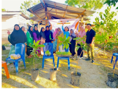
Gambar 4. Kegiatan Edukasi Pemanfaatan Pekarangan Rumah

pekarangan yang dimiliki. Peserta juga diberikan edukasi terkait dengan pemanfaatan pupuk kompos untuk menjaga keberlanjutan budidaya. Hal ini dikuatkan oleh temuan Sitiinjak et al. (2024), yang menegaskan bahwa optimalisasi pekarangan sebagai “lumbung hidup” melalui budidaya sayuran secara signifikan mendukung ketahanan pangan dan gizi keluarga.