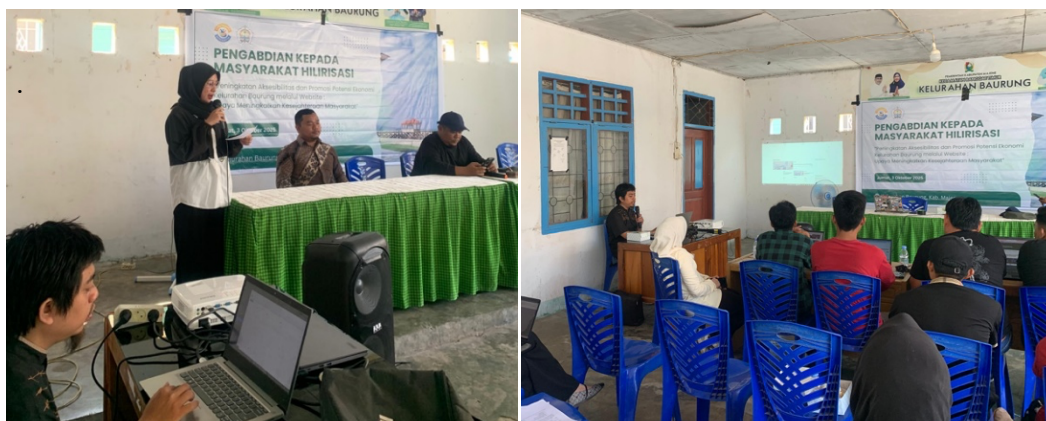
Gambar 4. Pendampingan Pengelolaan Website Kelurahan

Tahap selanjutnya implementasi, dilakukan pelatihan dan pendampingan langsung kepada aparat kelurahan baurung terkait pengelolaan dan penggunaan website kelurahan. Pada tahap ini, peserta diberikan bimbingan teknis mengenai cara mengoperasikan panel administrasi website, mengelola konten informasi, memperbarui berita dan pengumuman, serta mengunggah dokumen pelayanan publik. Selain itu, pelatihan juga mencakup penjelasan dan praktik penggunaan setiap fitur yang tersedia pada website, seperti fitur layanan administrasi daring, manajemen data kependudukan, publikasi kegiatan kelurahan, serta pengelolaan galeri dan dokumentasi kegiatan. Berikut gambar proses pendampingan penggunaan website.