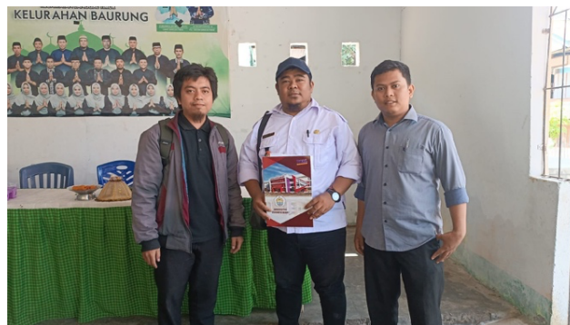
Gambar 3. Tahapan Komunikasi dengan Mitra

kelurahan di Kelurahan Baurung, Majene. Kegiatan dimulai dengan tahap persiapan di mana para mitra diajak berkonsultasi untuk mengidentifikasi permasalahan terkait layanan administrasi publik, pengelolaan situs web dijelaskan dan ditawarkan sebagai solusi, serta menyepakati jadwal pelaksanaan kegiatan.