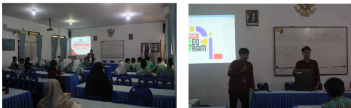
Gambar 5. Sesi Ice Breaking Pengenalan Geogram

Tahap inti kegiatan adalah Ekspedisi Geogram, yang dilakukan melalui Lomba dan Tantangan Berkelompok. Kegiatan ini berfokus pada Penguatan Konsep Geometri secara hands-on . Dalam sesi ini, siswa ditantang untuk memecahkan kartu tantangan yang meliputi pembuatan bangun datar, analisis simetri, dan implementasi transformasi geometri. Penggunaan Geogram mengubah suasana kelas dari pasif menjadi aktif dan partisipatif. Ekspedisi ini efektif karena menerapkan metode belajar berbasis permainan ( game-based learning ) yang memicu motivasi intrinsik. Dalam konteks penguatan konsep, ketika siswa diminta menyusun kepingan Geogram untuk membentuk trapesium atau layang-layang, mereka secara alami harus mengingat dan menerapkan sifat-sifat geometris bangun tersebut (misalnya, jumlah sisi, besar sudut, dan kesimetrian). Kegagalan dalam menyusun bentuk mendorong mereka untuk merefleksikan kesalahannya, sebuah proses yang sangat efektif dalam pembelajaran mandiri dan pemecahan masalah.