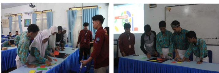
Gambar 6. Sesi Lomba dan Tantangan Berkelompok Implementasi Geogram

Kegiatan Ekspedisi Geogram melibatkan total 32 siswa yang bersemangat dalam sebuah tantangan konstruksi bentuk yang menuntut tidak hanya ketelitian, tetapi juga pemahaman mendalam tentang geometri transformasi. Antusiasme yang ditunjukkan oleh para siswa sangat tinggi. Seluruh peserta terlibat secara aktif, membentuk kelompok-kelompok kerja yang dinamis. Suasana kompetisi yang terjalin sangat sehat dan konstruktif. Hal ini terlihat dari kolaborasi internal kelompok yang kuat dan upaya keras mereka untuk menghasilkan bentuk konstruksi yang paling akurat dan kreatif sesuai instruksi yang diberikan. Salah satu capaian paling signifikan dari Ekspedisi Geogram ini adalah peningkatan pemahaman siswa terhadap konsep geometri yang sebelumnya dianggap sulit, khususnya perbedaan mendasar antara rotasi (perputaran) dan refleksi (pencerminan).