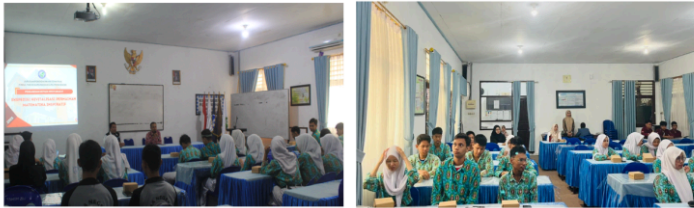
Gambar 4. Pembukaan Kegiatan oleh Kepala Sekolah SMAN 2 Tarakan

Kegiatan Pengabdian kepada Masyarakat (PkM) diawali dengan tahapan Pengantar yang bertujuan untuk menyambut resmi Tim PkM sekaligus meningkatkan kredibilitas program di hadapan guru dan siswa SMAN 2 Tarakan. Melalui sosialisasi dan orientasi program, Tim PkM berhasil mempresentasikan Revitalisasi Geogram sebagai strategi edutainment yang inovatif untuk penguatan konsep Geometri. Hasil dari tahapan ini terbukti efektif dalam membangkitkan motivasi serta mendorong partisipasi aktif peserta. Keberhasilan dalam memposisikan program sebagai aset penting sekolah juga tercapai, dengan harapan adanya keberlanjutan program sebagai upaya sistematis sekolah dalam meningkatkan pemahaman Geometri di masa mendatang.