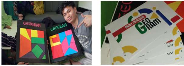
Gambar 3. Media dan Buku Panduan Geogram

Setelah produksi Geogram dan pencetakan modul selesai, tahap ini diakhiri dengan kontrol kualitas dan uji kelayakan media ( pilot test ). Kontrol kualitas sangat penting (Negara & Khoirotunnisa, 2025) untuk memastikan bahwa setiap kepingan Geogram memiliki presisi ukuran yang akurat, sebab kesalahan kecil dapat mengganggu konstruksi bangun datar dan merusak validitas demonstrasi konsep geometris. Uji coba terbatas dilakukan oleh beberapa siswa dan guru inti untuk memverifikasi akurasi konten pada Kartu Tantangan, serta menilai kemudahan penggunaan media dalam skenario kelas yang sesungguhnya. Berhasilnya tahap validasi ini menjamin bahwa media Geogram yang telah direvitalisasi adalah alat yang siap diimplementasikan ( ready-to-use ) dan efektif, sehingga meminimalisir kendala teknis saat dilaksanakan pada Tahap Implementasi utama: Ekspedisi Geogram di SMAN 2 Tarakan.