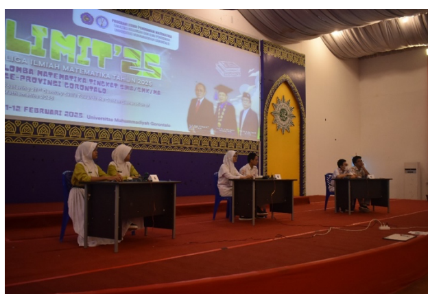
Gambar 3. Babak Final

Babak Semifinal dilaksanakan dalam bentuk cerdas cermat. Sembilan tim semifinalis dibagi ke dalam tiga grup, dengan setiap grup terdiri atas tiga tim. Tahap ini menggunakan dua kategori soal, yaitu soal wajib dan soal rebutan. Melalui format ini, peserta tidak hanya dituntut memahami konsep matematika, tetapi juga harus mampu mengambil keputusan dengan cepat, menjaga ketepatan jawaban, dan bekerja sama dalam tekanan waktu. Juara dari setiap grup kemudian melaju ke Babak Final. Tiga tim finalis berasal dari SMA Negeri 1 Tapa, SMA Negeri 3 Kota Gorontalo, dan SMA Negeri 1 Kabila.