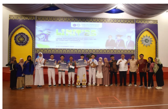
Gambar 5. Penyerahan Hadiah Lomba

Selain menghasilkan peringkat lomba, LIMIT '25 juga memberikan pengalaman kompetitif yang bermakna bagi peserta. Selama pelaksanaan kegiatan, peserta menunjukkan partisipasi aktif dalam mengikuti setiap tahapan lomba, baik pada tes tertulis maupun cerdas cermat. Pada babak penyisihan, peserta dituntut bekerja secara mandiri dan teliti, sedangkan pada babak berikutnya peserta didorong untuk berdiskusi, menyusun strategi, dan mengambil keputusan bersama. Perubahan bentuk kegiatan dari tes individu ke kerja tim dan cerdas cermat memperlihatkan bahwa kompetisi ini tidak hanya mengukur kemampuan akademik, tetapi juga melatih komunikasi, kolaborasi, sportivitas, dan kesiapan menghadapi tekanan waktu.