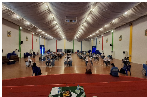
Gambar 2. Babak Penyisihan

bertujuan memetakan kemampuan dasar matematika peserta, tetapi juga menilai keseimbangan kemampuan individu dalam satu tim. Skor dari dua anggota tim diakumulasikan untuk menentukan peringkat tim. Berdasarkan hasil penilaian, sebanyak 20 tim atau sekitar 60% dari peserta awal melaju ke Babak Penyisihan II. Babak Penyisihan II diikuti oleh 20 tim dan dilaksanakan dalam bentuk tes isian singkat. Pada tahap ini, peserta mengerjakan 20 butir soal secara berkelompok dalam waktu 40 menit. Format kerja tim digunakan untuk mendorong diskusi, pembagian strategi, ketelitian, dan kemampuan menyelesaikan soal secara kolaboratif. Dari babak ini, 9 tim terbaik dinyatakan lolos ke Babak Semifinal.