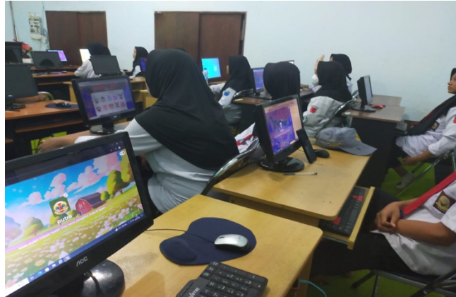
Gambar 2. Praktik Penggunaan Kahoot di SMKS Trunojoyo

ini, siswa tidak hanya belajar secara teoritis, tetapi juga langsung mempraktikkan pemahaman mereka melalui latihan soal yang menyenangkan. Selain itu, penggunaan Kahoot juga dapat menciptakan suasana kompetitif yang sehat di antara siswa. Adanya sistem skor dan peringkat dapat mendorong siswa untuk berusaha lebih baik dalam menjawab pertanyaan. Hal ini secara tidak langsung dapat meningkatkan motivasi belajar serta rasa percaya diri siswa. Dengan demikian, penerapan Kahoot sebagai media pembelajaran dan penilaian interaktif diharapkan dapat menjadi solusi untuk mengatasi permasalahan yang dihadapi dalam pembelajaran Bahasa Inggris di SMK Trunojoyo Jember, khususnya dalam meningkatkan pemahaman grammar siswa kelas 10.