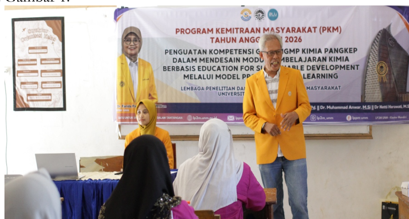
Gambar 3. Dokumentasi kegiatan pelatihan dan pendampingan penyusunan modul pembelajaran kimia berbasis ESD-PjBL

Selama kegiatan berlangsung, peserta menunjukkan antusiasme yang baik. Hal ini terlihat dari keterlibatan peserta dalam sesi diskusi, kesediaan mengemukakan permasalahan pembelajaran yang dihadapi di sekolah, serta keaktifan dalam merancang ide proyek yang sesuai dengan materi kimia. Peserta juga memberikan tanggapan terhadap kemungkinan penerapan modul di kelas, terutama terkait kebutuhan penggunaan bahasa yang sederhana, contoh yang dekat dengan kehidupan peserta didik, dan aktivitas proyek yang dapat dilakukan dengan alat dan bahan yang tersedia di lingkungan sekolah. Antusiasme peserta juga tampak pada saat pendampingan, ketika peserta mendiskusikan cara menghubungkan konsep kimia dengan isu lingkungan dan keberlanjutan. Dokumentasi suasana penyampaian materi, diskusi, dan pendampingan penyusunan modul dapat ditampilkan pada Gambar 1.