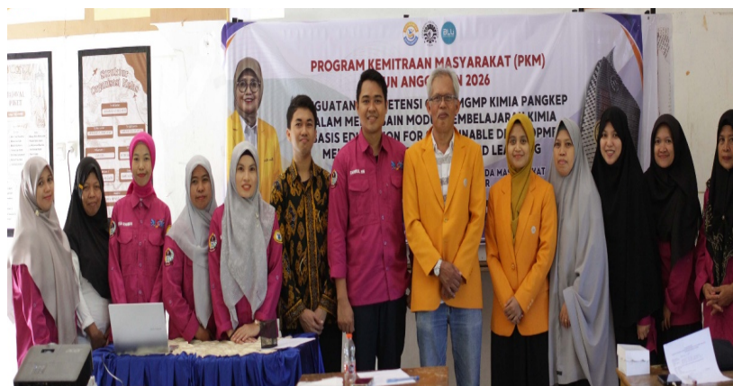
Gambar 2. Dokumentasi kegiatan pelatihan

Kegiatan pengabdian kepada masyarakat berupa pelatihan mendesain modul pembelajaran kimia berbasis Education for Sustainable Development (ESD) melalui Project-Based Learning (PjBL) dilaksanakan secara tatap muka bersama guru-guru yang tergabung dalam MGMP Kimia Kabupaten Pangkep. Kegiatan ini dirancang sebagai respons terhadap kebutuhan mitra dalam mengembangkan perangkat ajar kimia yang lebih kontekstual, aplikatif, dan relevan dengan isu keberlanjutan. Permasalahan utama yang dihadapi mitra adalah masih terbatasnya pengalaman guru dalam mengintegrasikan isu ESD ke dalam materi kimia serta menyusunnya dalam bentuk modul pembelajaran berbasis proyek. Oleh karena itu, kegiatan pelatihan tidak hanya berfokus pada penyampaian materi, tetapi juga diarahkan pada praktik penyusunan rancangan modul, diskusi, dan pendampingan agar peserta memperoleh pengalaman langsung dalam mengembangkan perangkat pembelajaran.